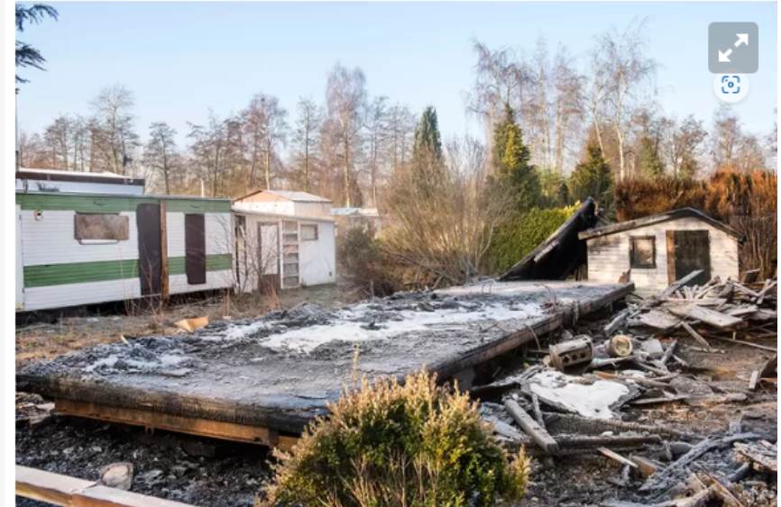
▲ Reportage situatie en mensen op Fort Oranje in Rijsbergen