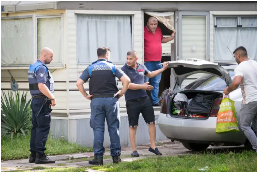
▲ Bewoners brengen bezittingen onder bij een buurman die voorlopig mag blijven wonen in zijn caravan.