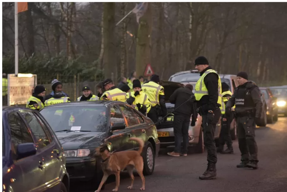
▲ Controle bij camping fort Oranje.